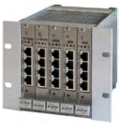
Beispiel für 19" Basiseinheit I

Das IDT 32 ist ein modernes High-End-Steuerzentrum mit flexibelsten Einsatzmöglichkeiten in der Zutritts-, Alarm-, Brandmelde- und Videotechnik. Durch die modulare Bauweise kann mit bis zu 21 Steckplätzen im Plug-and-Play Verfahren die individuelle, auf den Kunden zugeschnittene Lösung realisiert werden.