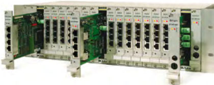
Beispiel für 19" Variante mit Vollausbau Basiseinheit II