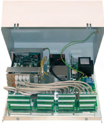
Basiseinheit III (Wandgehäuse) im Vollausbau