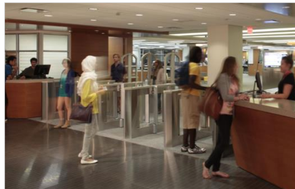
En relation avec les systèmes de contrôle d'accès