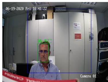
Enregistrement de la température du corps au moyen d'une caméra à imagerie thermique