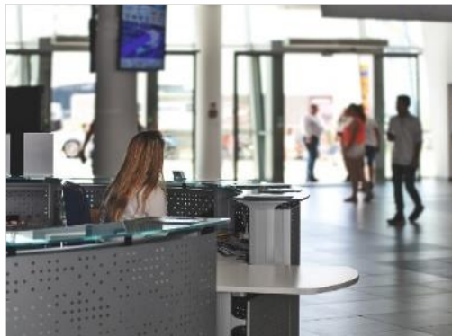
Dans les zones d'entrée des bâtiments publics