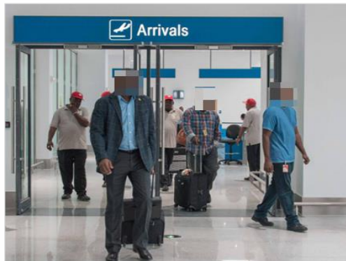
Dans les espaces publics, par exemple les aéroports